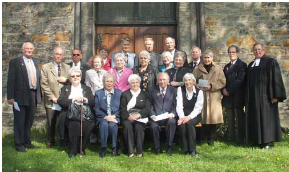
Die Diamantenen Konfirmanden