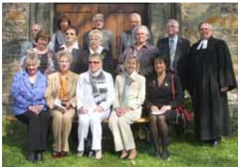
Die Goldenen Konfirmanden

Sicherlich: In den 50 oder 60 Jahren nach der Konfirmation hat sich mancher verändert. Alle haben viel erlebt. Und so schloss sich nahtlos an die Frage „Bist du das wirklich?“ auch die Frage an „Wer bist du heute?“. Wie der festliche Gottesdienst am Vormittag gehörte deshalb zu diesem Tag auch das Kaffeetrinken am Nachmittag im