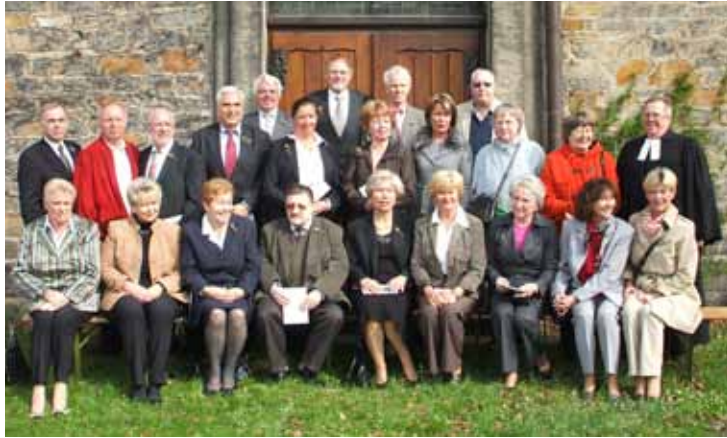
Die Goldenen Konfirmanden

Wenige von uns leben noch in Limmer. Ist Limmer für die anderen auch ein schönes,