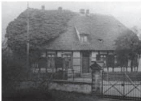
Das 3. Schulgebäude in Limmer (1809-1936)

geöffnet an jedem zweiten Sonntag im Monat nach dem Gottesdienst von 11 bis 12 Uhr, sowie an jedem letzten Sonntag zwischen 14 und 16 Uhr.